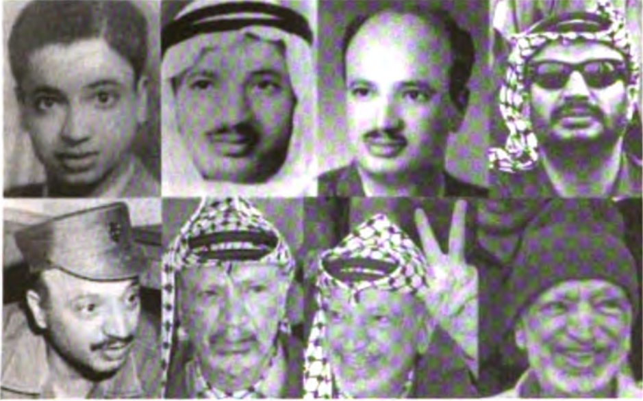
ياسر عرفات في مختلف مراحل حياته